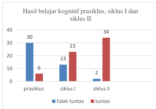
Gambar 1. Diagram hasil belajar siswa pada ranah kognitif Pra Siklus Siklus 1 dan II