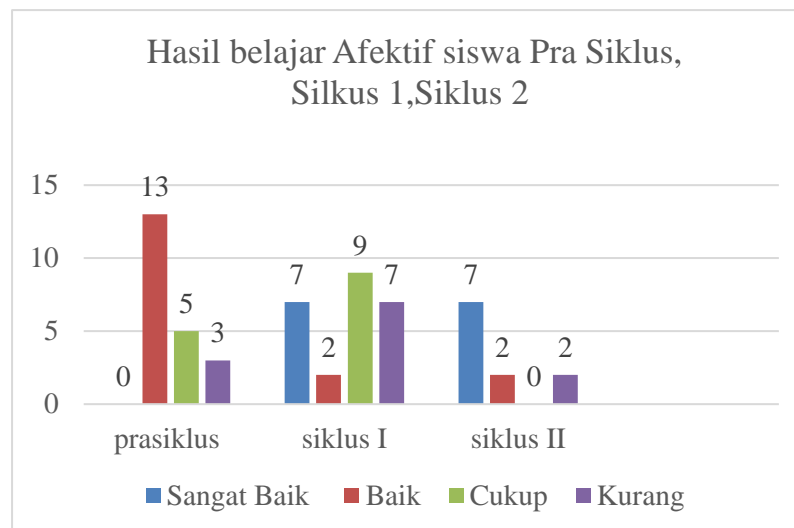
Gambar 2. Diagram penilaian hasil belajar Afektif siswa Pra Siklus, Siklus 1, Siklus 2