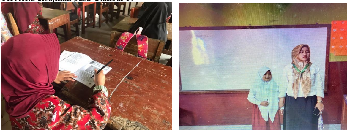
Gambar 3. Pelaksanaan Metode Bercerita

Proses pembelajaran memang erat kaitannya dengan peran seorang guru dalam memilih metode pembelajaran yang tepat. Pencapaian tujuan pembelajaran tidak lepas dari peran seorang guru. Guru dalam memilih metode harus memiliki inovasi yang tinggi, akan tetapi harus memberikan kesempatan ke siswa untuk aktif. Students center , sedangkan guru hanya memantau dan mengkondisikan proses pembelajaran. Pemilihan metode dan media yang tepat dapat mencapai tujuan pembelajaran yang telah dirumuskan. Proses pembelajaran yang berlangsung terbagi atas tiga tahapan yaitu pembukaan, kegiatan inti dan kegiatan penutup. Berikut ini adalah dokumentasi pelaksanaan proses pembelajaran dengan menerapkan metode bercerita disajikan pada Gambar 3.